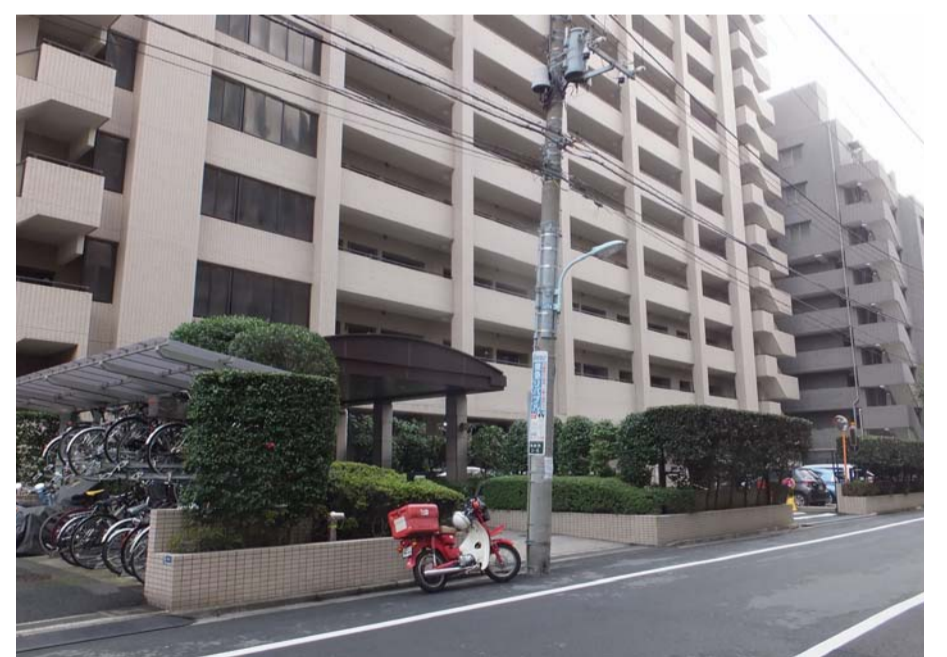
平成26年(2014年)：法政大学跡地付近

中央労働学園大学 → 法政大学社会学部・法政大学工学部 麻布新堀町 (現在の港区南麻布2丁目)