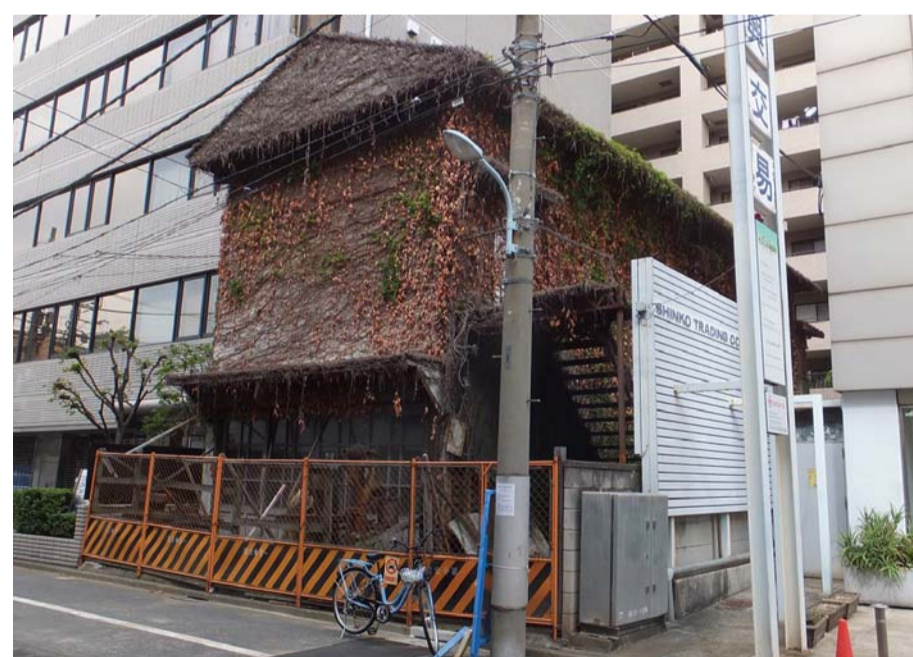
平成26年(2014年)：法政大学跡地付近