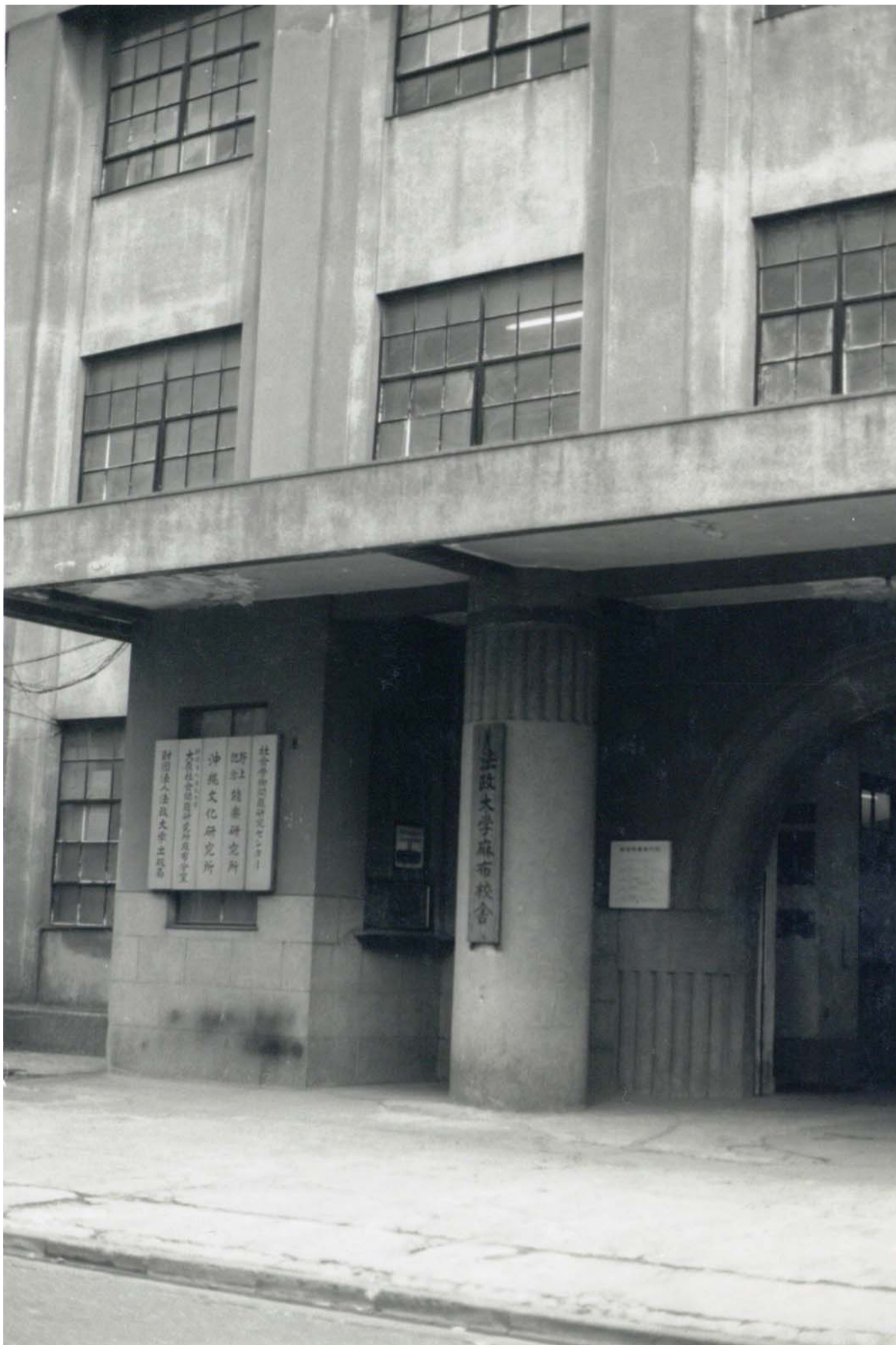
昭和 55年(1980年)：麻布校舎玄関