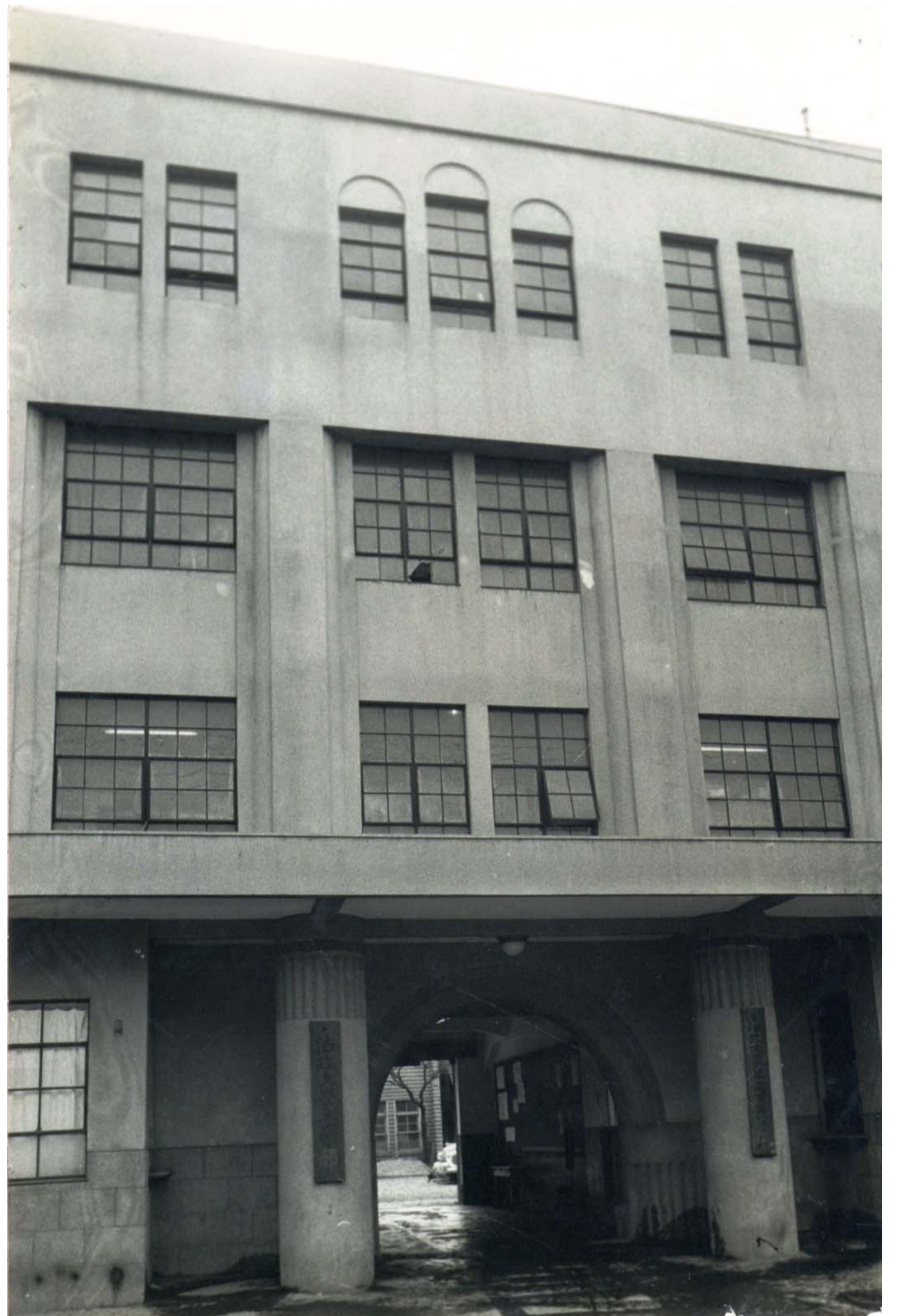
昭和 27~40年(1952~65年)：麻布校舎