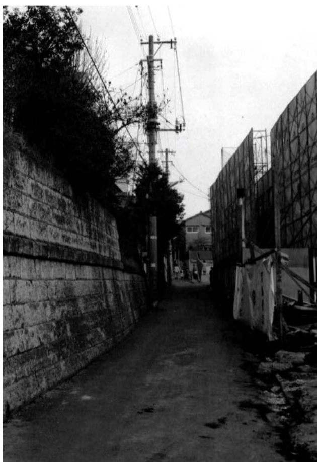
昭和 50年(1975年) ：紺屋坂 坂上を

この坂付近に紺屋(染物屋)があったのでこう呼んだ。また江戸時代、坂のがけ下がごみ捨て場だったことからごみ坂ともいった。下ってゆくと筈(こうがい)小学校の正門に出る。正門の前は五叉路になっていて、角に2000年ころまで「こうがい堂」という文具店があった。文房具ばかりでなく、「たけひご」や「きびがら」のような工作に使う品物もあり、筈小学校の生徒は、皆このお世話になったものだ。