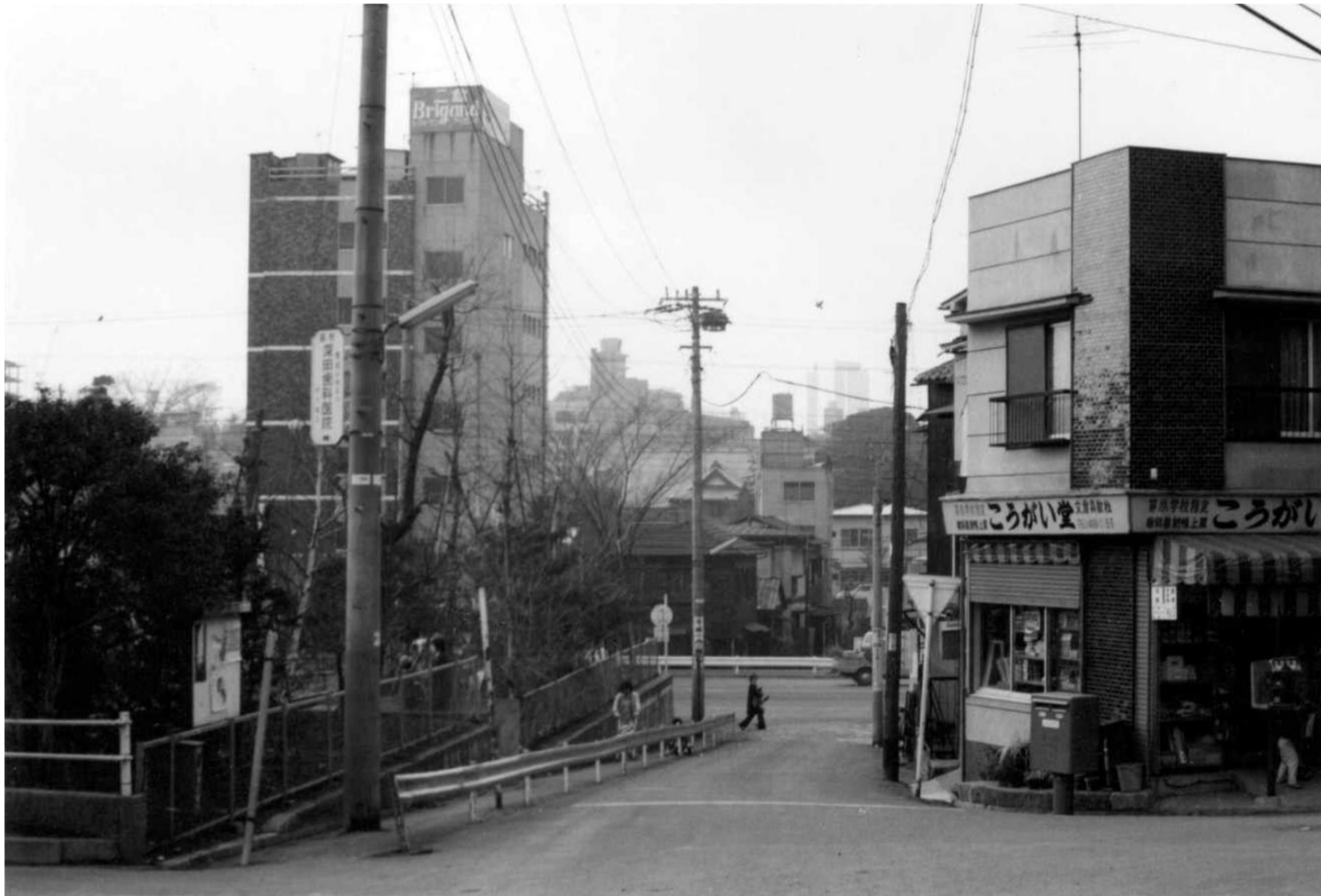
昭和 50年(1975年)：紺屋坂 坂下の景