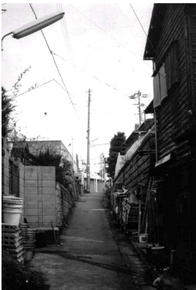
昭和 50年(1975年) ：紺屋坂 坂下から