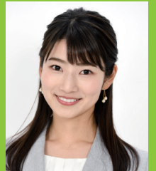
安藤萌々 (テレビ朝日アナウンサー)