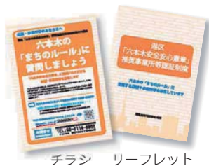
チラシ リーフレット

港区では、平成26年4月に港区「六本木安全安心憲章」推奨事業所等認証制度を創設しました。この制度は直接店舗や事業所等に対し、憲章への賛同の可否及び憲章の理念に即した活動の有無といった確認を求める働きかけを行っていくことにより、相乗的な周知・浸透を図っていくことを目的としています。