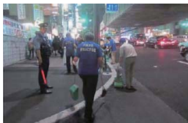
六本木をきれいにする会の活動の様子

港区麻布地区総合支所では、同様の活動を実施している団体等に対して清掃道具の貸出等の支援を行っています。