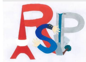
黒川 真帆 (クロカワ マホ) : 中学3年