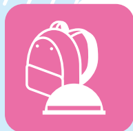
がけ地や河川の近くでは早めに避難の準備をする