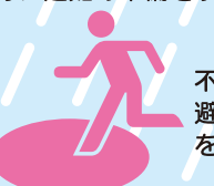
不安を感じた場合には、区からの避難情報を待つことなく自主避難をする