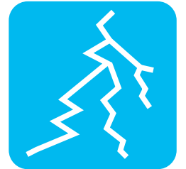
地面に亀裂が入る