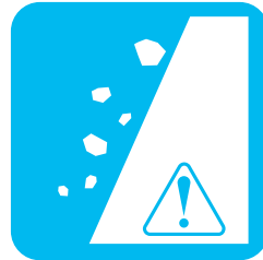
斜面から小石が落ちる