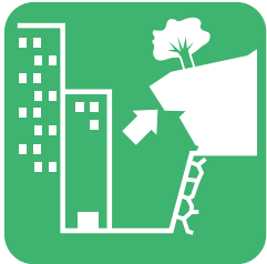
斜面の一部が飛び出している