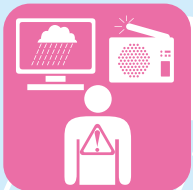
気象情報に注意する