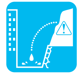
がけから水が湧き出る