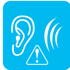
木の根が裂けるような音や地鳴りがする