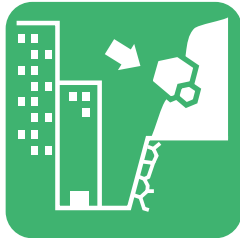
斜面に浮いているような石がある