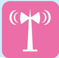
防災関係機関の広報を聞き逃さないようにする