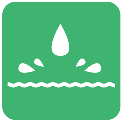
斜面から水がわきでている