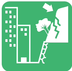
斜面に割れ目がある