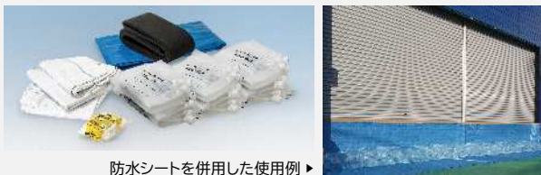
防水シートを併用した使用例▶

土を用意しにくい都市部などで活躍する水のう。破れにくい高強度極厚素材なので複数回使用できます。防水シートや止水クッションを併用すれば効果が高まります。