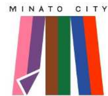
▲港区シティプロモーション シンボルマーク

認定された事業は、区が所有するプロモーショングッズの貸出し、港区シティプロモーションシンボルマークのデータ提供のほか、区の情報発信媒体（ホームページやSNSなど）による周知を行うとともに、認定区分に応じて事業に係る経費の一部を助成するなど、積極的に事業の支援を行うことで、行政だけでなく、個人・団体等が相互に連携、協働を図り、港区の力を結集したシティプロモーションを推進します。