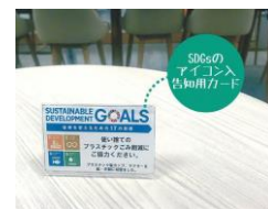
取り組み周知カード

加えて、持続可能な開発目標 SDGsへの取り組みとともに、プラスチックごみ削減を周知・促進するカードも設置しました。