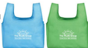
オリジナルエコバッグ

プラスグループオリジナルエコバッグを製作し、国内全グループ・全社員に配布。昼食の買い物時に「レジ袋要りません」を宣言する活動を実施するなど、使い捨てレジ袋ごみの削減に取り組んでいます。