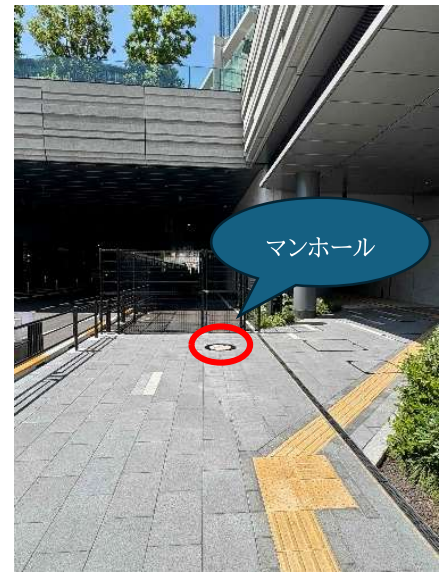
⑥少し進むと、正面フェンスの前にデザインマンホールがあります。