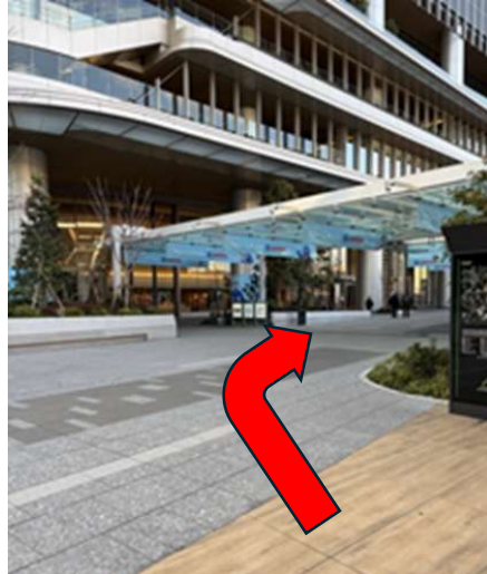
②北改札を出たら右方面へ進みます。