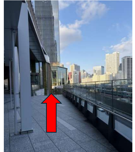
③少し進むと下へ下りる階段が見えます。