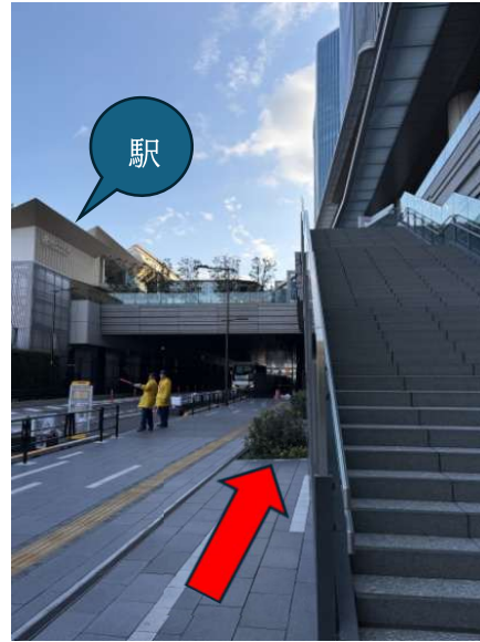
⑤階段を下りたら右後ろを向きます。(JR 高輪ゲートウェイ駅が左奥に見えます)