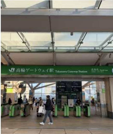
①JR 高輪ゲートウェイ駅北改札 (2F) から外に出ます。