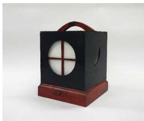
有明行灯