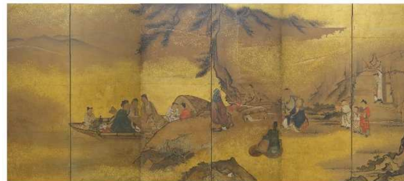
しほんちやくしよくきん きしよが ずびょうぶ 紙本着色琴棋書画図屏風 1点 宗教法人種徳寺蔵