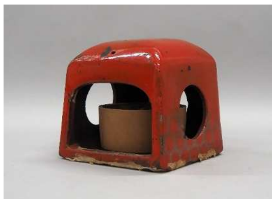
あんか 港区立郷土歴史館蔵