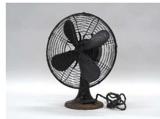
扇風機 港区立郷土歴史館蔵