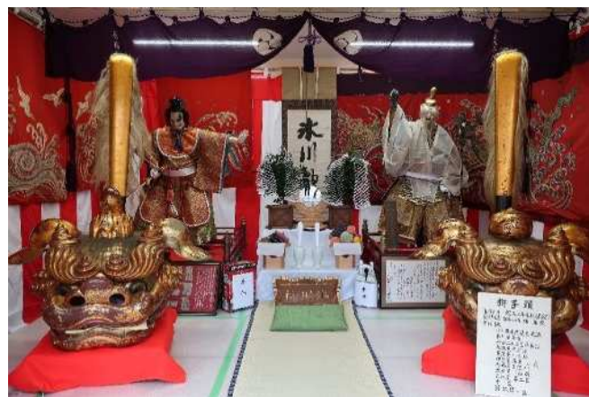
麻布本村町会 麻布氷川神社祭礼関連資料 17 点 の一部 麻布本村町会蔵