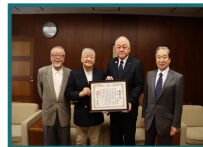
東麻布街づくり協議会の皆様と森舟形町長（右から2番目）

https://www.city.minato.tokyo.jp/azabukyoudou/hunagatamachi.html (山形県舟形町 町政施行70周年特別自治功労表彰式の様子)