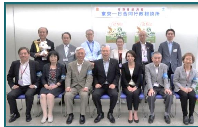
清家区長と行政相談委員の皆様

庁舎内や区民まつりでの行政相談所ブースの提供や、行政相談委員と区長との意見交換会の実施などの取組が評価された。