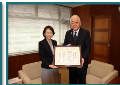
清家区長（左）と森舟形町長（右）