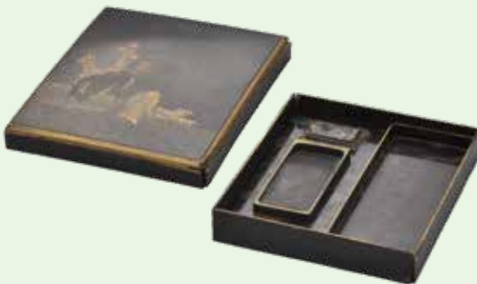
我善坊谷遺跡出土遺物 硯箱 江戸時代[郷土歴史館蔵]

品川台場(第五)(港南五丁目所在) 我善坊谷遺跡(麻布台一丁目所在) 圓福寺跡遺跡(愛宕一丁目所在) 湖雲寺跡遺跡(六本木四丁目所在)