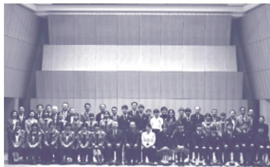
昨年度の発表会の様子

日時 令和8年1月24日(土) 午後2時から4時30分頃まで 場所 コクヨ株式会社 東京品川オフィス THE CAMPUS (港区港南一丁目8番35号) ※事前申込みは不要です。直接会場にお越しください。