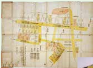
南日下久保町・宮村町・永坂町沽券図 延享元(1744)年 [郷土歴史館蔵]

有形文化財(古文書) 南日下久保町・宮村町・永坂町沽券図 1点 有形文化財(古記録) 慶應義塾三田演説会資料 11点