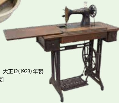
足踏式ミシン 大正12(1923)年製 [郷土歴史館蔵]