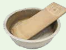
金だらいと洗濯板 昭和30年代 [郷土歴史館蔵]

当館では、さまざまな昔の道具を収集しています。本展では、港区内外から寄贈された衣類に関わる道具を展示し、その使い方や道具の移り変わりを、大人にも子どもにもわかりやすく紹介します。また、小学校3年生の社会の単元「道具とくらしのうつりかわり」も学べます。