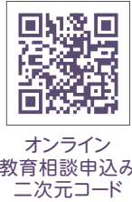
オンライン 教育相談申込み 二次元コード

なお、令和3年7月からは新たにオンライン（Zoom）での教育相談を開始しました。事前予約制で原則1回の御相談となります。詳しくは教育相談のホームページをご確認いただき、専用フォーム ( https://forms.office.com/r/3NVBvXYpMz ) よりお申込みください。