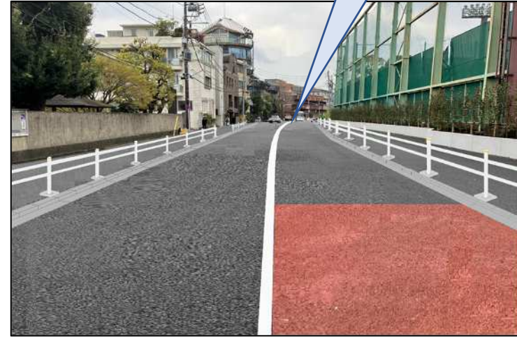
工事後のイメージ