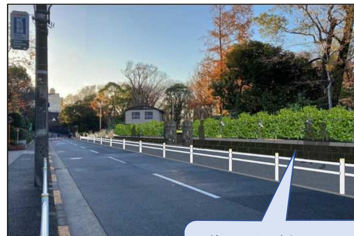
工事後のイメージ

石積みを公園側へ6mセットバックし、歩行空間を創出します。一時的に広い歩行空間となります。