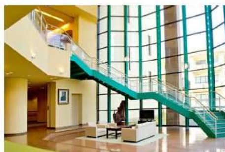
管理棟 玄関ホール