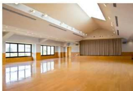
宿泊棟 レクリエーションルーム