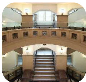
旧公衆衛生院内観