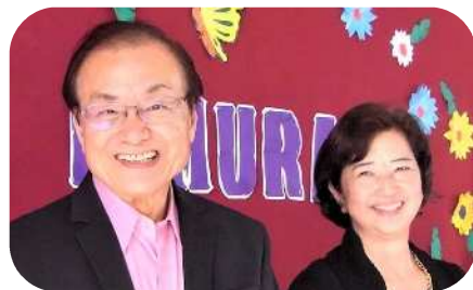
2021年にフィリピンで