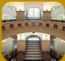
旧公衆衛生院内観