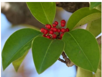
季節の移ろいも見つけましょう。