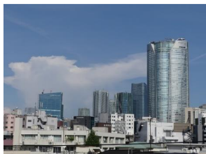
西麻布のギャラリー屋上から。