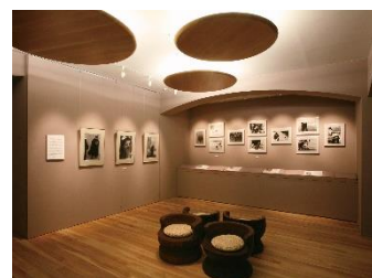
秋山庄太郎写真芸術館 第1展示室