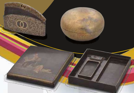
我善坊谷遺跡出土遺物 左上: 櫛 右上: 合子 下: 硯箱 [当館蔵]