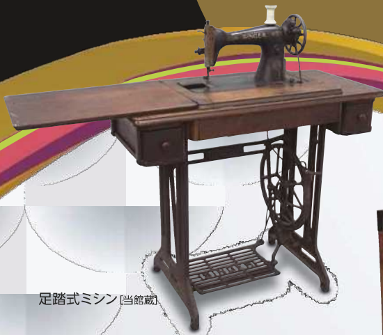
足踏式ミシン [当館蔵]