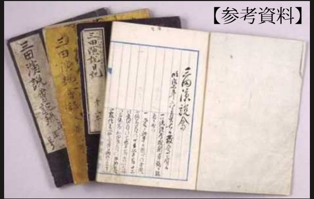
慶應義塾三田演説会資料 明治7～33(1874～1900)年