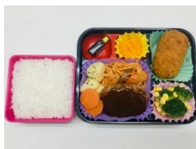
【日更便当的图片示例】