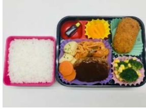
【오늘의 도시락 이미지】