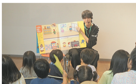
防災紙芝居の様子