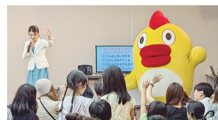
そらジローの防災ステージ