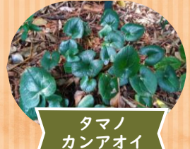
タマノカンアオイ