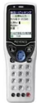
⑤☑ンディターミナル