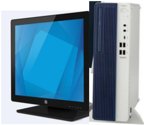
①図書館資料自動貸出機