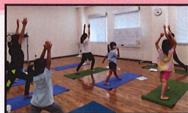
(昨年度の事業の様子)

親子で一緒にポーズに挑戦！ 楽しく体をと心をほぐすヨガ時間です。英語も交えて実践します。