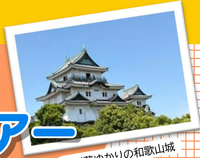
紀州藩ゆかりの和歌山城