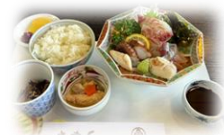
※活魚料理の写真はイメージです