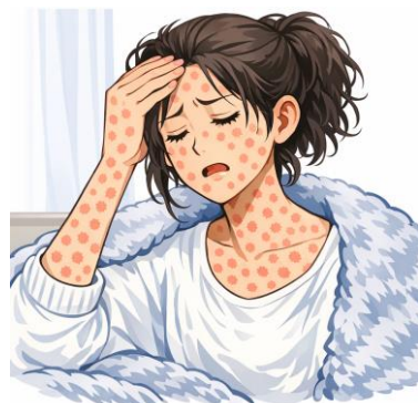
※イラストは文章生成AIにより作成