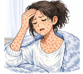
※イラストは文章生成AIにより作成