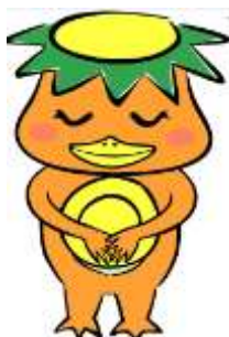
港区リユースキャラクター