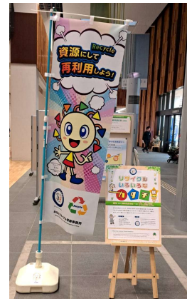
〈みなとりサイクル清掃事務所〉