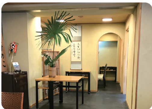
ひと月ごとにメニューが変わり季節を感じられる