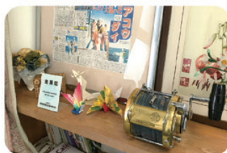
深海にひそんでいる アコウダイを攻略