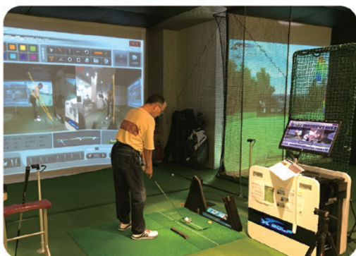
正面・後方からの スイングを確認できる