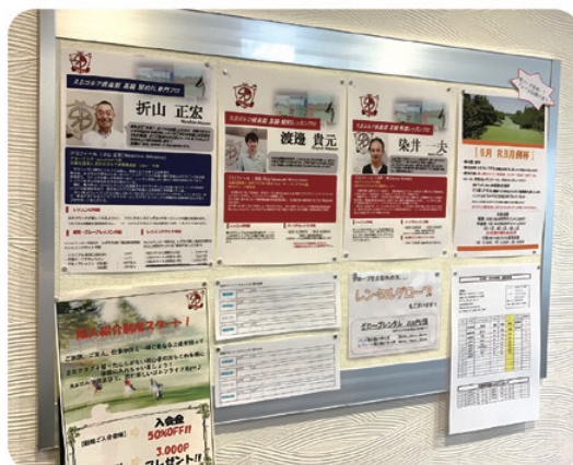
1回15分から1年間まで様々なレッスンコース有