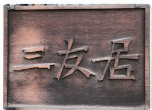
京都の本店は、 お茶会などの仕出しが主