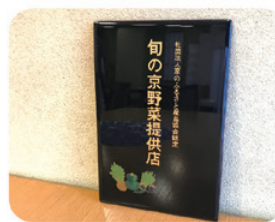
京の台所、京都市場から 毎日新鮮な食材が届く