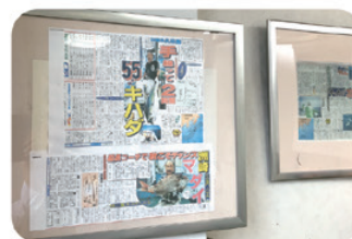
特大55キロの キハダマグロを 2匹釣った記事