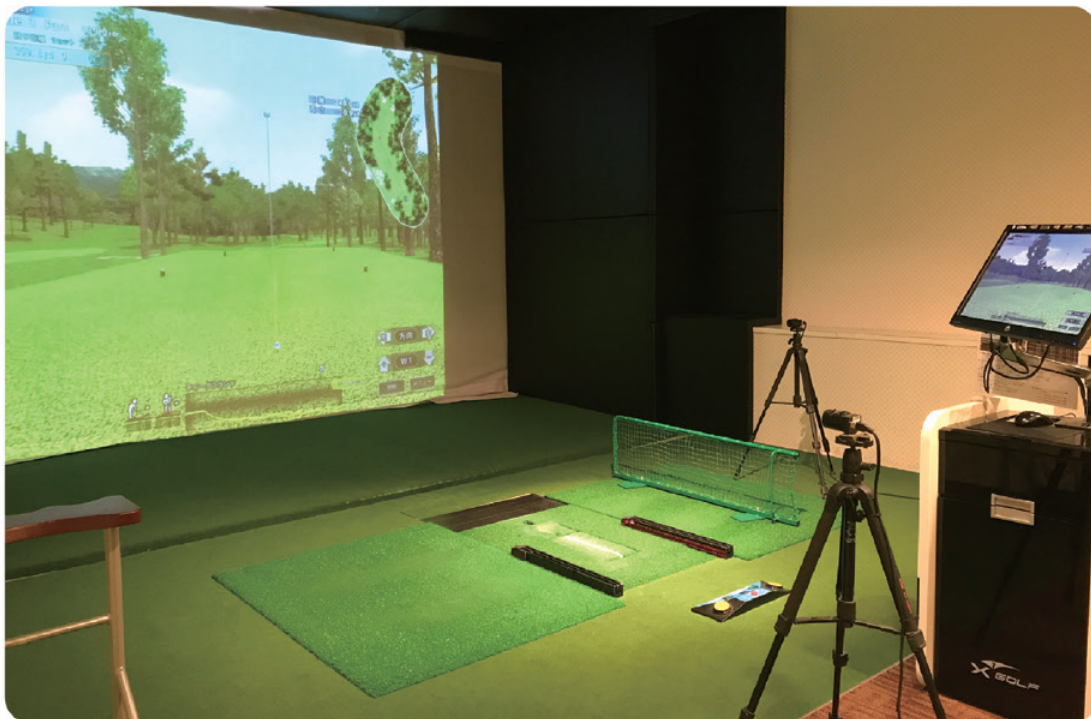
3Dで映しだされる ラウンドは臨場感がある