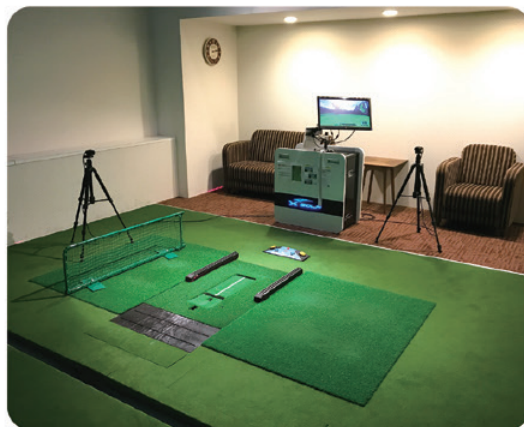
最先端のセンサーシステムで計測と分析を行う

ゴルフ好きのオーナーが、理想の練習場とレッスンを具現化した【R.B ゴルフ倶楽部高輪】。テーマは「気軽に本格的に」で、高輪と田町に2店舗を構える。プロ選手も利用する最先端ゴルフシミュレーター「X-GOLF PRO」を全打席に導入し、スイングフォームやボールとクラブの軌道を多角的に分析できる。ショットの反復練習、コース練習、国内外のゴルフ場モードでラウンドを回ること。あわせてプロによるパーソナルレッスンも受けられるので上達が早いと評判だ。会員以外も利用可能な個室は飲食物持ち込み可で、グループでゴルフゲーム的な楽しみ方が可能。グローブさえ持参すれば、無料レンタルクラブに、シューズも用意されているので気軽に立ち寄れる。