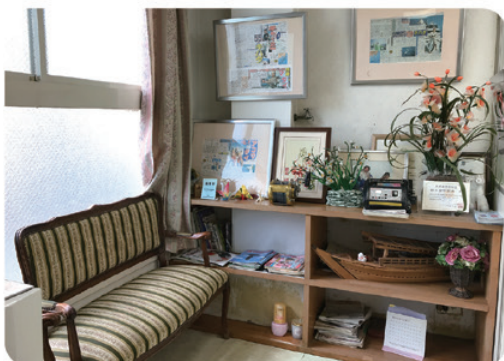
あらゆる人々への治療で、社会貢献している