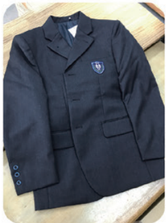
転入生に備えて各校の布地の 在庫は万全だ