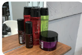
レディースシェービングや 育毛ケアも行う