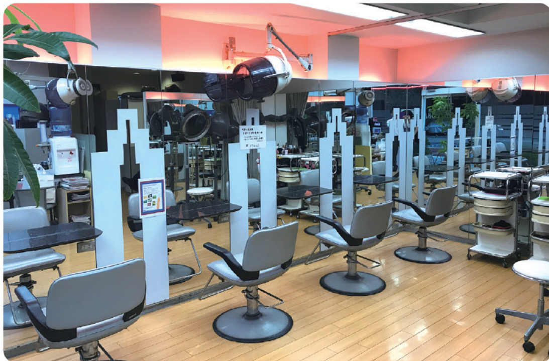
頭皮を整えるヘッドスパは 2,000円～4,000円