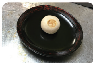
忠臣蔵にちなんだ 討入りそばまんじゅう