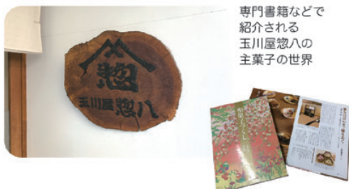
専門書籍などで 紹介される 玉川屋惣八の 主菓子の世界