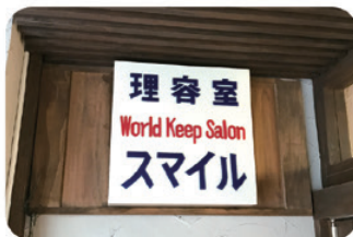
先代から受け継ぐ看板