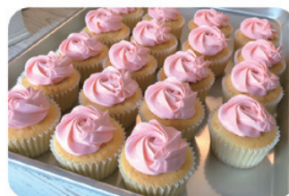
バラの花のようなバタークリームは見た目もかわいい。