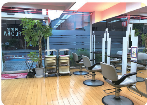
高輪地区限定で出張可(出張料2,000円)