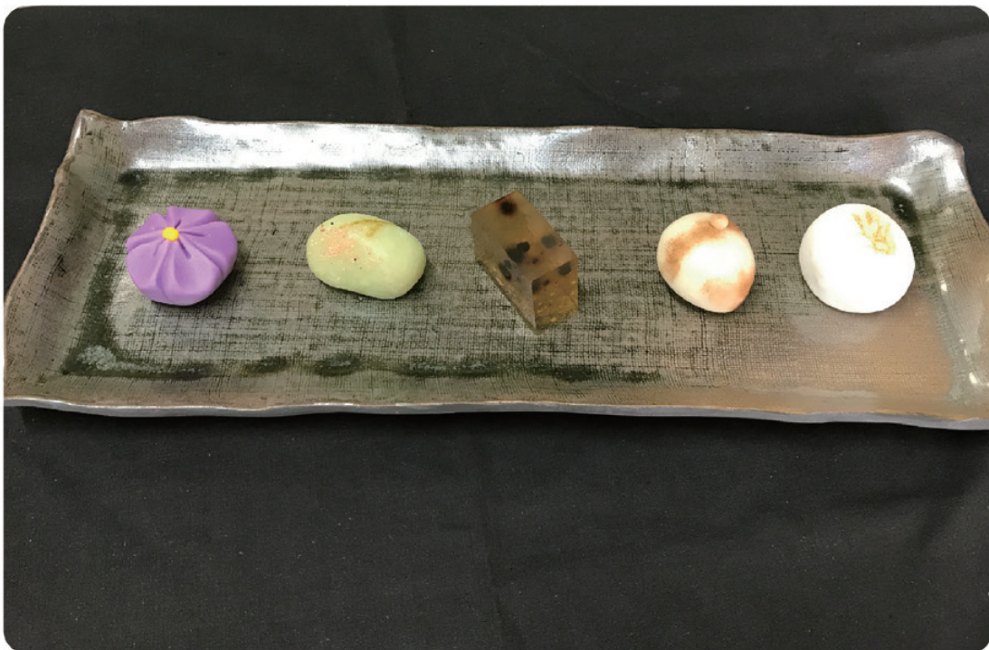
主菓子づくりで忙しく店頭販売は数に限りが