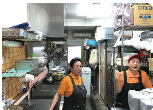
独立前は2人とも別の弁当屋で10年間働いていた