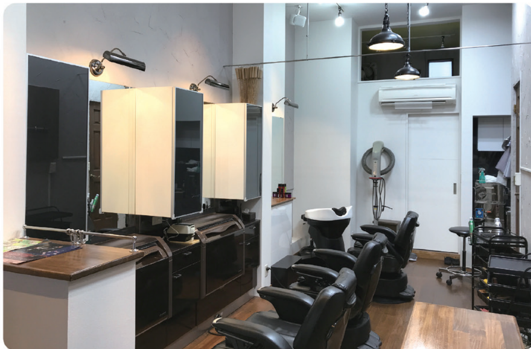
バリアフリーの店内は 広々してゆっくりくつろげます