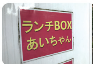
配達は大店のご主人、 息子夫婦もサポート