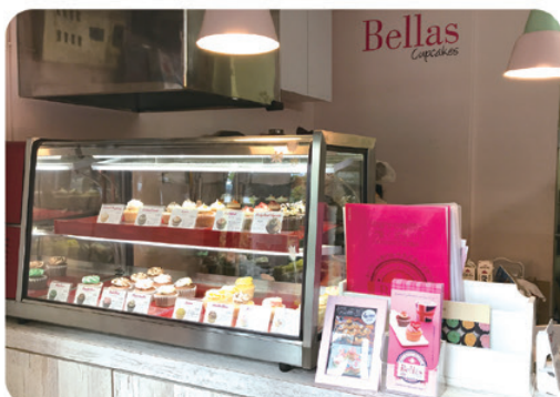
イギリス伝統のレシピにこだわっている