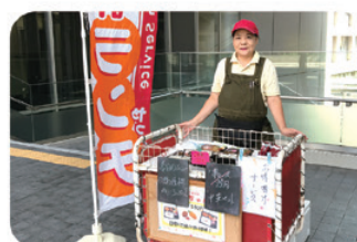
地域の要望があり、 5年前から 東海大でも販売