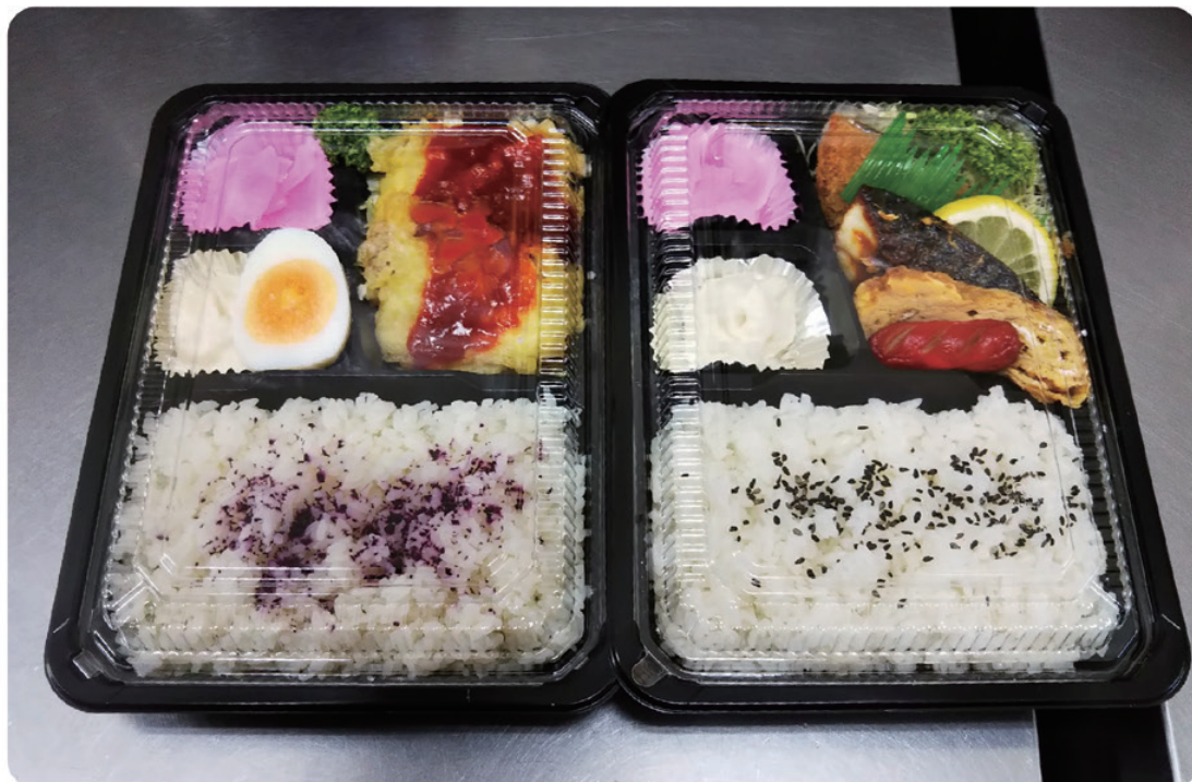
オードブルなどは 注文時に料理を打合せできる