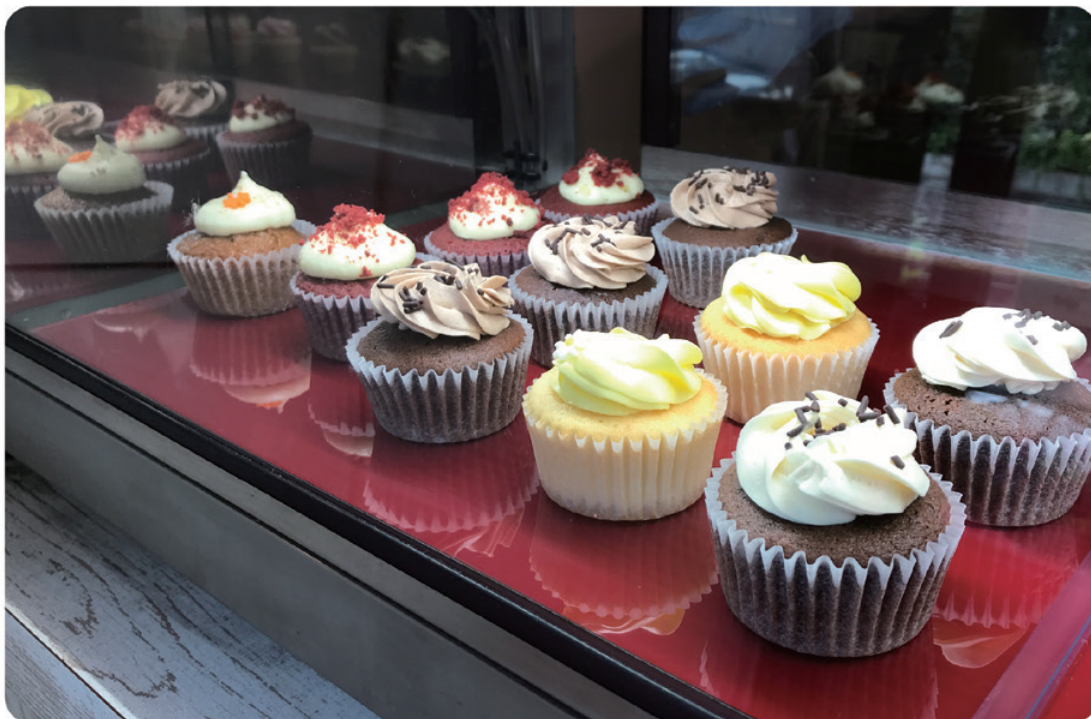
店名のベラはイギリスの女の子をイメージ