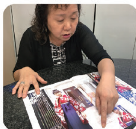
貸衣装は「晴れ着の丸昌」の カタログを用意