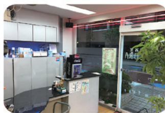
開店時間前の 予約もできる (早朝料金2,000円)