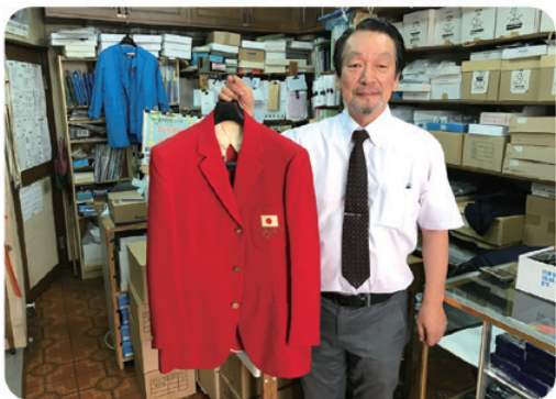
昭和の東京オリンピックのユニフォームも手掛けた