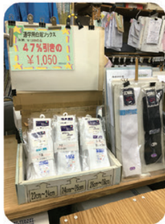
指定用品の販売や イベントの法被なども