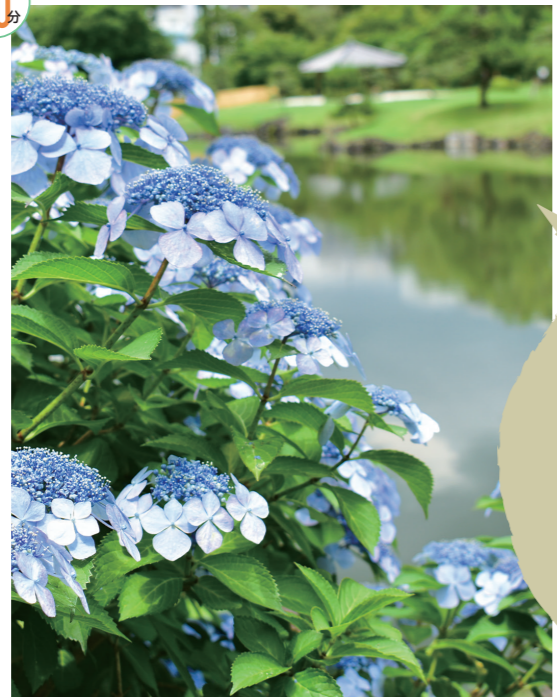
四季折々のお花を楽しめます。

日本庭園を眺め花を愛でる 江戸初期の大名庭園の面影を今に伝える名園の一つ。回遊式庭園の特徴をよくあらわした庭園で、大泉水を中心とした地割りや石組の配置が非常に優れ、国の「名勝」に指定されています。 ☎03-3434-4029 9:00~17:00 (16:30閉門) ●一般150円、65歳以上70円(小学生以下及び都内在住・在学の中学生は無料) 身体障害者手帳、愛の手帳、精神障害者保健福祉手帳または療育手帳持参の方と付添の方は無料。