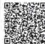
港区ホームページ

外出や入浴時に転倒等の不安がある高齢者に日常生活用具を給付し、日常生活の安全性を高め、自立した生活を支援します。