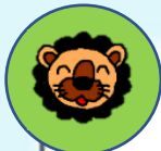
らいおん組(5歳児クラス)

赤と青の台紙の色を自分で選び好きな方の色で鯉のぼりを作りました。鱗の模様は絵具を用いて表現しています。目と鱗を糊で貼り付けて完成です。室内に飾った鯉のぼりを「ぼくのこれだよ」「わたしはあか」など自慢気に紹介してくれます。