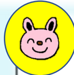
うさぎ組(2歳児クラス)

カラーの丸シールを鯉の模様に見立てました。指先を上手に使って貼り付けています。まだ難しい友だちもいましたが、保育士と一緒に楽しみながら行いました。貼り付けられると嬉しそうに拍手をして喜ぶ姿が見られました。