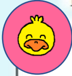
あひる組(1歳児クラス)