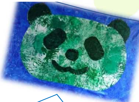
3歳児クラス ぱんだ組

手に絵の具をつけてペタペタ。手に絵の具をつけて伸ばし手を繰り返して伸ばします。顔をつけてかわいいぱんだの完成！