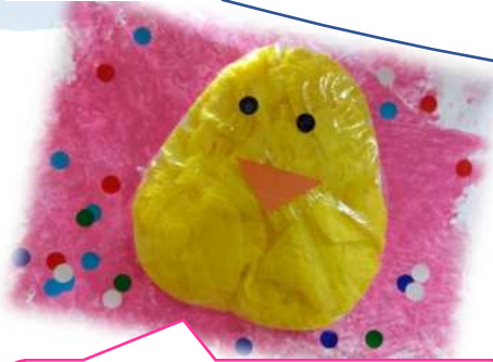
0 歳児クラス ひよこ組

今月の園だよりは、先月行われた『親子ふれあいフェスタ』を彩ったクラス旗を紹介します♪