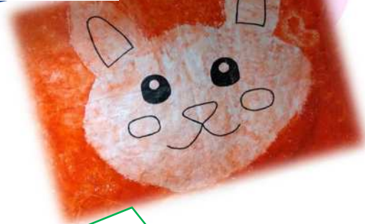
2歳児クラス うさぎ組

絵の具をつけて手で伸ばすと、絵の具がはじいてうさぎの形になりました。顔を描き、かわいいうさぎに大変身！