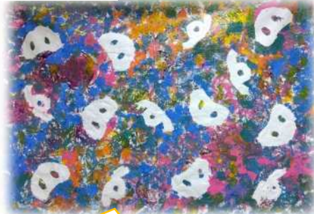
1歳児クラス こぶた組