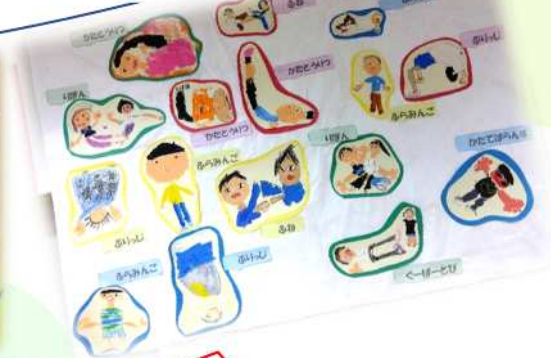
5歳児クラス らいおん組