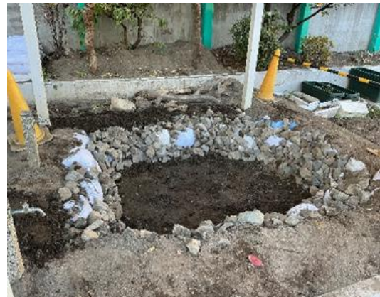
(児童が考案したビオトープのデザイン)