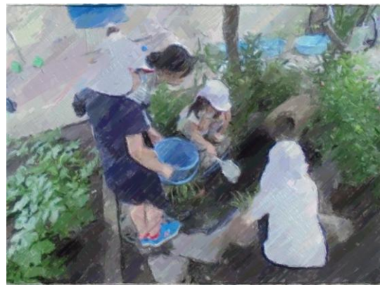
(教員とビオトープを整備している様子)