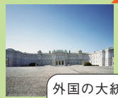
迎賓館 State Guest Houses

外国の大統領や首相などの賓客をもてなす国の迎賓施設です。賓客が利用している期間を除き、一般に公開されています。