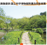
国立科学博物館 附属自然教育園 Institute for Nature Study