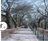
青山霊園 Aoyama Cemetery

外国の大統領や首相などの賓客をもてなす国の迎賓施設です。賓客が利用している期間を除き、一般に公開されています。