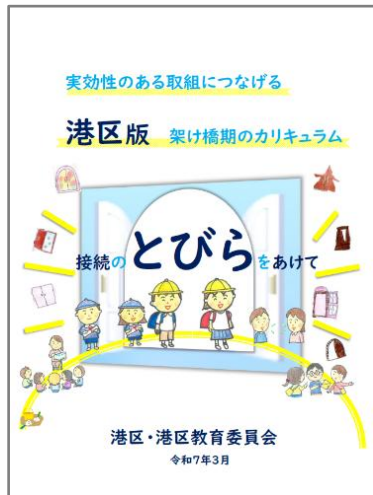
実効性のある取組につなげる 「港区版 架け橋期のカリキュラム ー接続のとびらをあけてー」