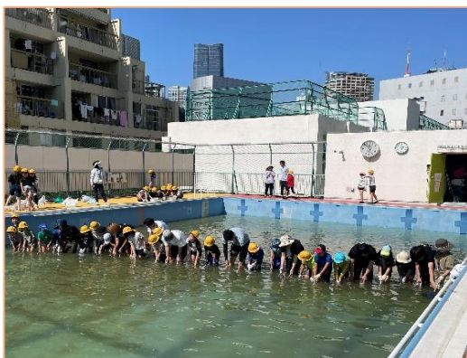
みんなで追い込んで