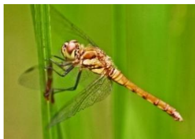
アカトンボ類（アキアカネ）