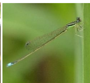
イトトンボ類（アジアイトトンボ）