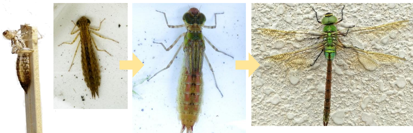
小さいヤゴ（左） 成虫になる直前のヤゴ（真ん中） ギンヤンマの成虫（右）

成長の早かったヤゴは、救出観察会の翌日にトンボになったものもいました。トンボになる直前には、ヤゴの眼が黒くなり、体の色も変わってきます。そうなったら、必ず容器のふたを開けて、割りばしなどの棒を立ててあげましょう。