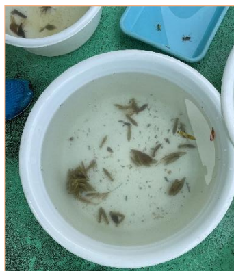
たくさんヤゴがとれました！

ことし しょうがっこう おお きゅう 今年も、小学校ごとに多く救 うしゅつ しゅるい ちが 出できたヤゴの種類が違いまし た。どうしてなのか理由をトン ボたちに聞いてみたいですね！