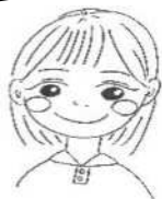
すえし なつ 栄吉 七夏