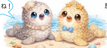
せいちゃん なんちゃん