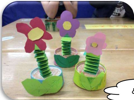
こうさく わくわく工作「ゆらゆらお花かざり」 はな