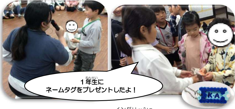
あそ みんなで遊ぼう「はじめましての会」 かい