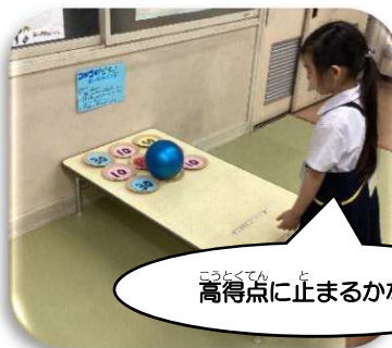
チャレンジタイム 「コロコロ!ピタッ!ボールチャレンジ!」