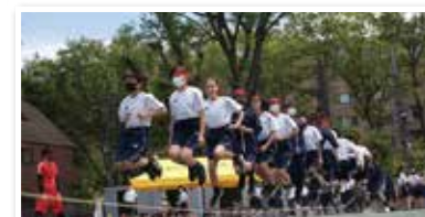
運動会伝統種目 大縄跳び