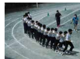
伝統のムカデリレー