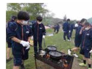
ハラハラドキドキ1年移動教室