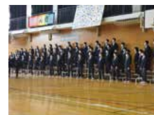
コンサート形式の合唱発表会