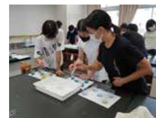
楽しい小学生体験授業