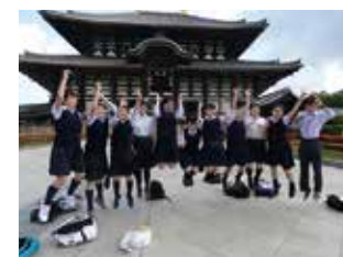
歴史に親しむ3年修学旅行