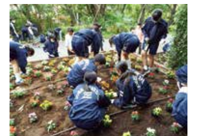
美化ボランティア