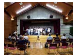
自然や人と触れ合う2年夏季学園