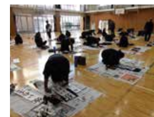
だれもが真読席書会