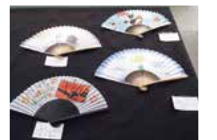
学習作品展示週間