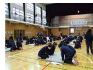
全校で競う百人一首大会