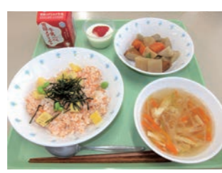
桃の節句メニュー