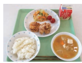
バランスの取れたメニュー