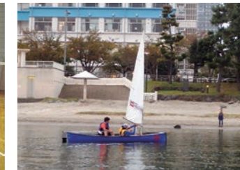
セーリングヨット部