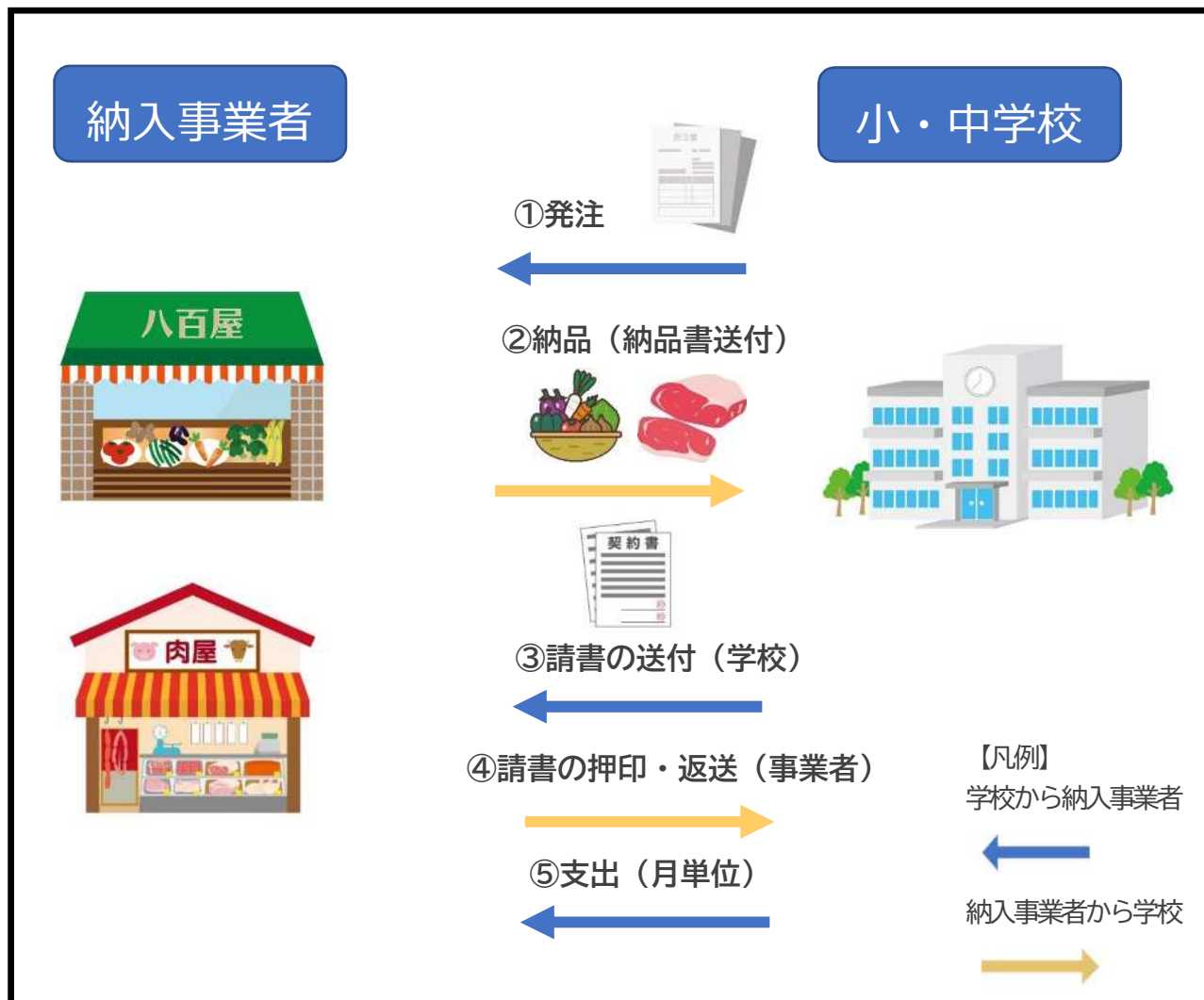
物資発注から支出までの全体イメージ図