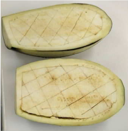
【写真A】米なすの皮目近くに、切り込みを入れる。格子状に切り込みを入れる。皮目にも 2~3本切り込みを入れておくと食べやすい。