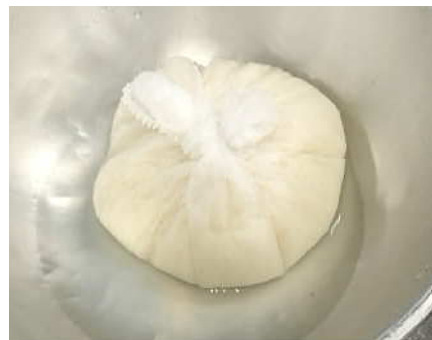
【写真 F】写真は、ネットを用いて大根おろしの水分切っているが、目の細かいざるでもよい。