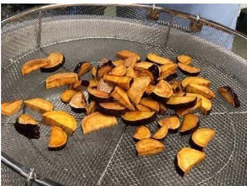
【写真E】さつまい目は水分をしっかり切り、160度程度の油でゆっくり揚げる。