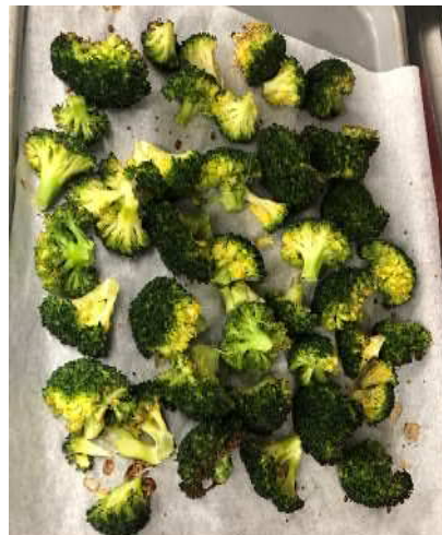
【写真D】ブロッコリーを炒め、焼き色が付いたら醤油をかける。(写真は、オーブンで焼いた状態)