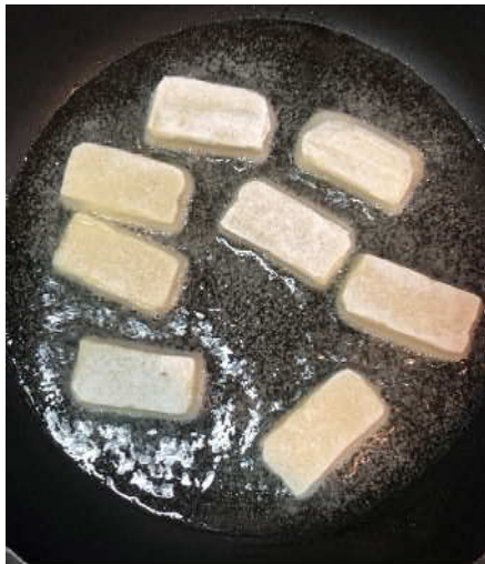
【写真 C】生麩に、まんべんなく片栗粉を付け、油で揚げる。表面がきつね色になり、少し膨らんだら揚げ上がり。