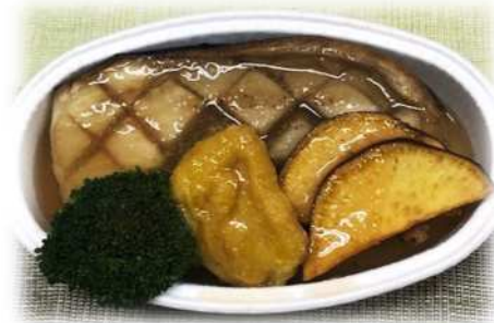
学校で提供した 米なすの煮おろし