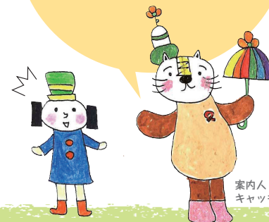
案内人 キャッチーさん

エイズだけじゃないよ。 性感染症はかかると 大変な思いをするんだ。 でも、知ってれば簡単に防げるよ！ いっしょに勉強しよう！