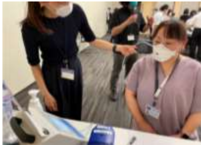
M I C Cの感染対策訓練 マスクフィットテストの様子