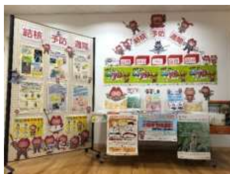
保健所での結核予防月間 パネル展示