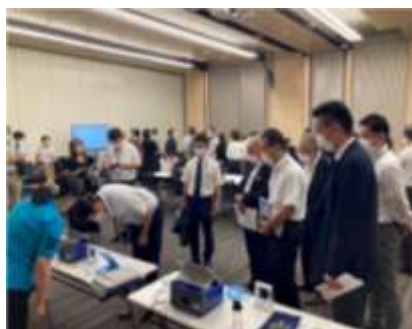
M I C Cの感染対策訓練 全体の様子

また、医療機関においては、院内感染対策委員会や感染制御担当者等を中心に院内感染の防止を図るとともに、実際に行った防止策に関する情報を、都や他の病院等の施設に提供するなど、その共有に努めます。