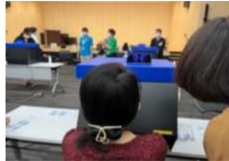
M I C Cの感染対策訓練 手指衛生評価テストの様子