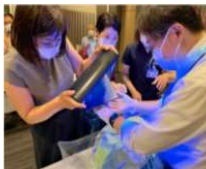
M I C Cの感染対策訓練 排泄物処理手技訓練の様子